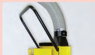
Poignée plus ergonomique