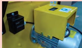
Puissance 2,2 kWh