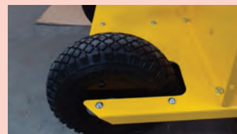
Roues gonflables crantées