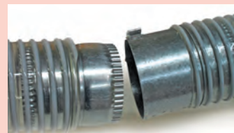
Raccordement aux flexibles pré-montés avec serrage rapide