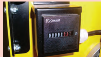
Compteur horaire d'utilisation