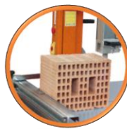
Convient de manière optimale pour le béton cellulaire et des briques.