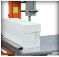
Profondeur coupe 650 mm.