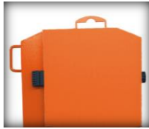
Dispositifs de levage