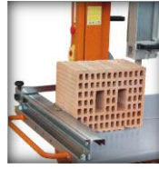
Table de coupe couissante