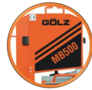
Volants de ruban de scie à dimension optimale garantissant une grande longévité du ruban de scie.

Scie à brique à ruban robuste et mobile avec table de coupe repliable permettant la coupe de briques de grande dimension.