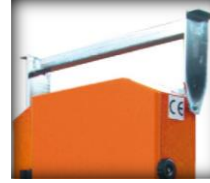
Barre de transport (accessoire)