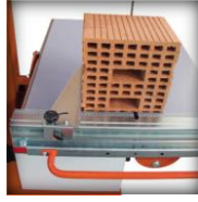
Butée angulaire (0-90°)