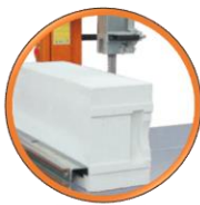
Arrêt automatique du ruban en fin de coupe