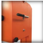
Système de tension du ruban