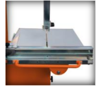
Table de coupe à charnière double