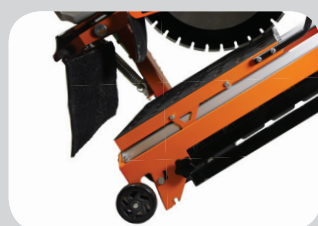
Roues de transport