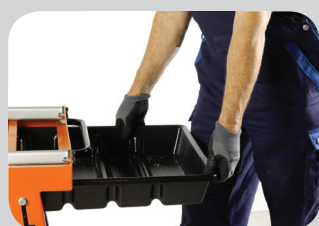
Bac à eau amovible