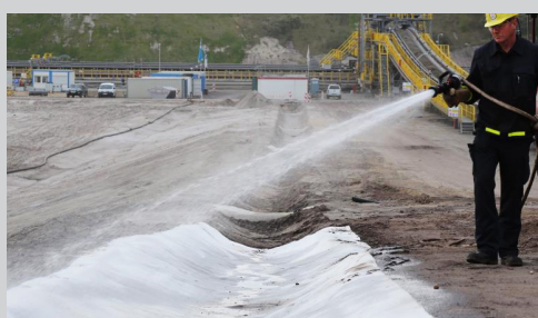
4- Arrosage abondant.