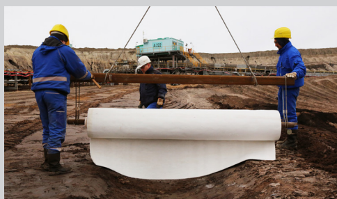
2- Déroulage du TILTEX® .

Il est important que l'emballage ne soit pas endommagé avant son ouverture. Si l'emballage a été endommagé durant le transport, il convient de bien vérifier que le produit n'a pas été hydraté et qu'il n'a pas durci.