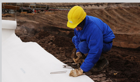
3- Mise en œuvre des fixations latérales.

Les rouleaux de Tiltex® de grande largeur doivent être déroulés à l'aide d'éléments de levage et d'un palonnier adaptés.