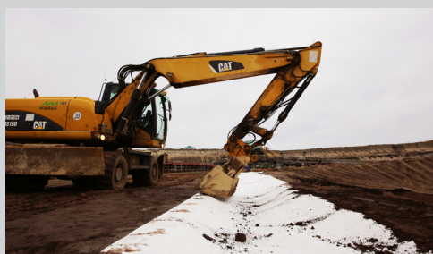
5- Fossé terminé.

Fin de la mise en œuvre, le fossé est protégé.