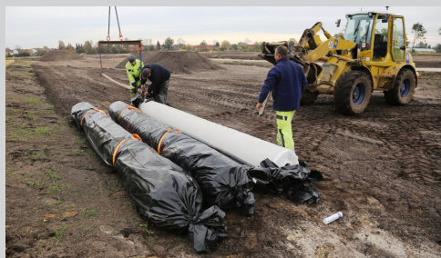
1- Ouverture de l'emballage des rouleaux.

Exemple de la mise en œuvre de Tiltex® dans un fossé :