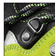
HAIX® 2-Zone Lacing