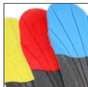
Vario Wide Fit System