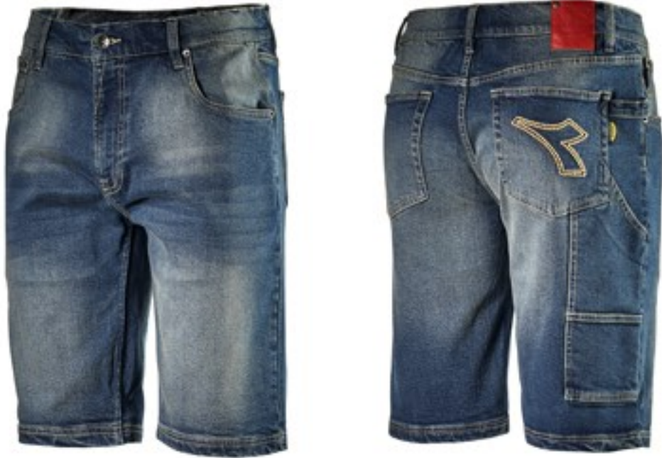
C6207 - LINGE SALE