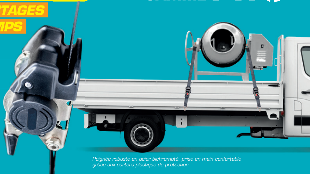
Poignée robuste en acier bichromaté, prise en main confortable grâce aux carters plastique de protection

Idéal pour arrimer des charges sur plateau, remorques et arrimage intérieur.