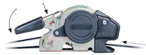
Positionnement de la poignée en débrayage pour enrouler la sangle automatiquement.