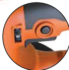
Bouton de verrouillage et variateur de vitesse Vergrendelingsknop en toerenregelaar