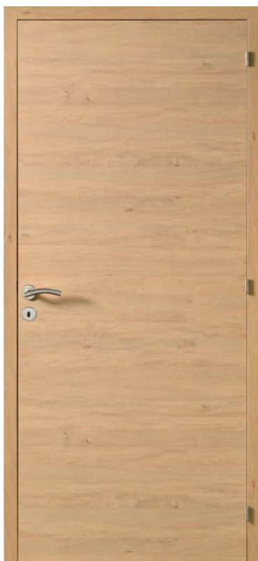
Fuji décor Natura structuré

La collection Mélaminé apportera à votre intérieur luminosité et modernité grâce à des finitions douces et actuelles. Sobre et structurée, cette ligne à la fois esthétique et accessible habillera parfaitement votre nouvelle habitation.