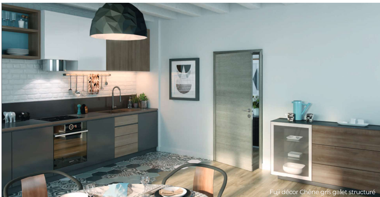
Fuji décor Chêne gris galet structuré

Descriptif technique Fuji: parement médium 4 mm, décor mélaminé structuré à fil horizontal. Disponible en âme pleine ou alvéolaire, huisserie non structurée, pose fin de chantier ajustable de 72 à 110 mm. Hublot en verre dépoli trempé 4 mm sur Kyoto. Ferrage 3 paumelles et 4 sur option âme pleine.