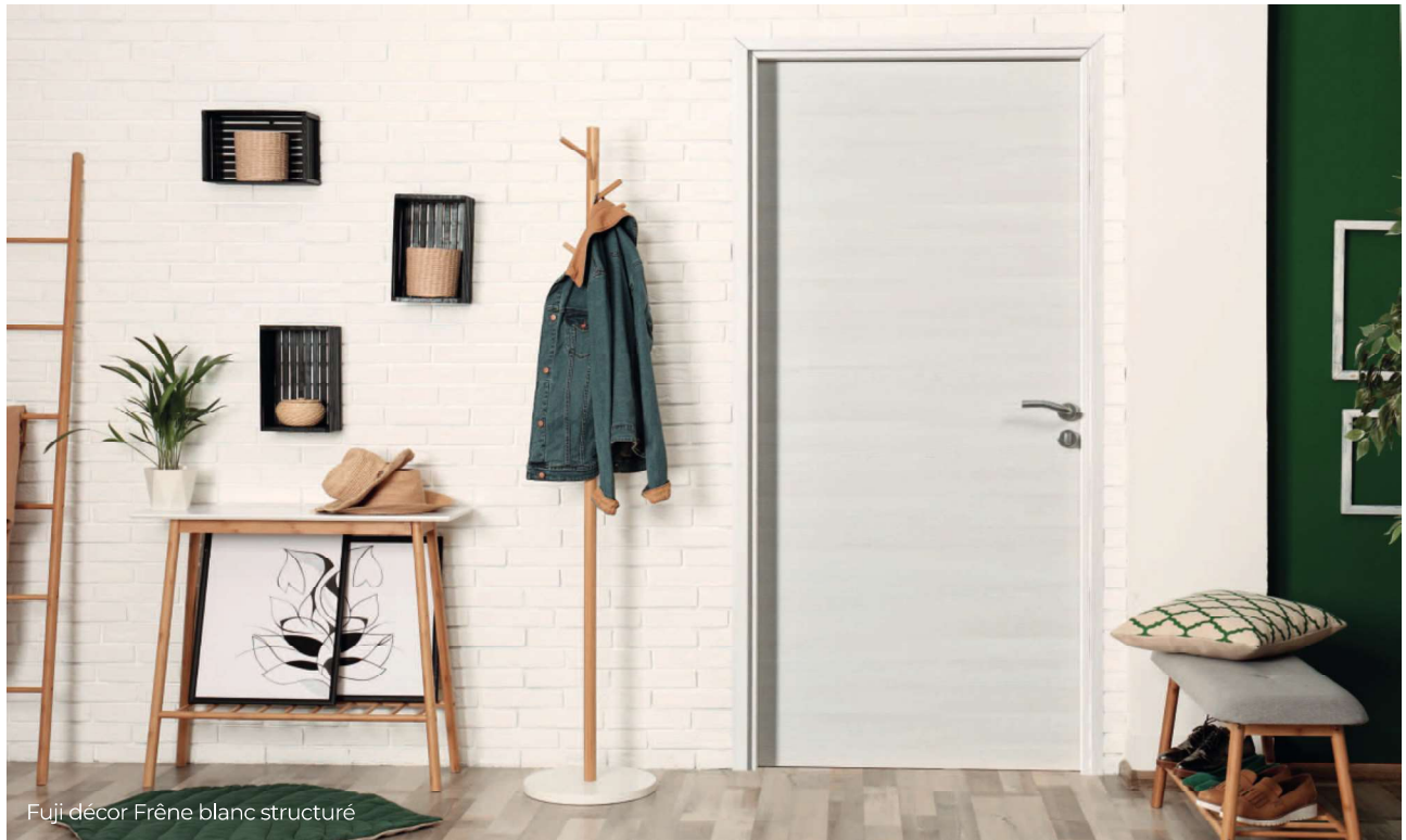
Fuji décor Frêne blanc structuré