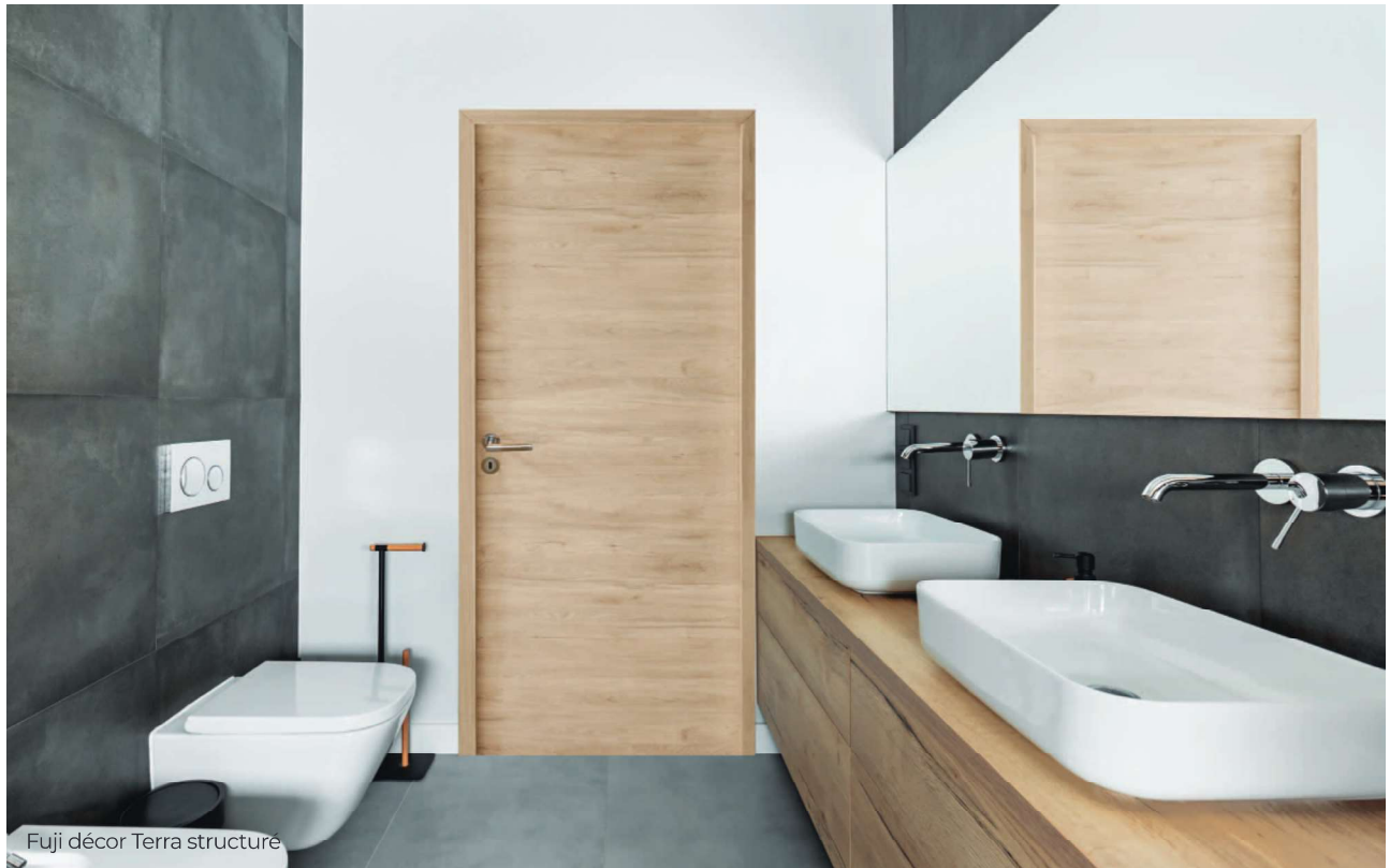
Fuji décor Terra structuré