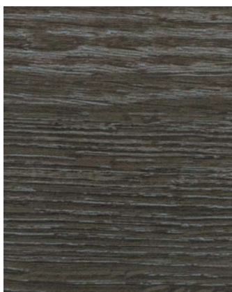
Décor mélaminé structuré à fil horizontal