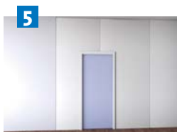
5 Navibloc® intégré dans la cloison finie.