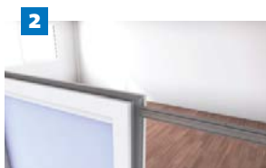
2 Mise en place du rail haut.