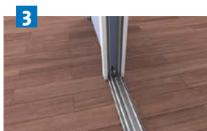
3 Mise en place du profil guide bas.